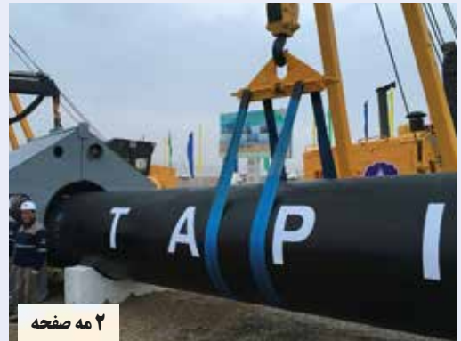
۲ مه صفحه