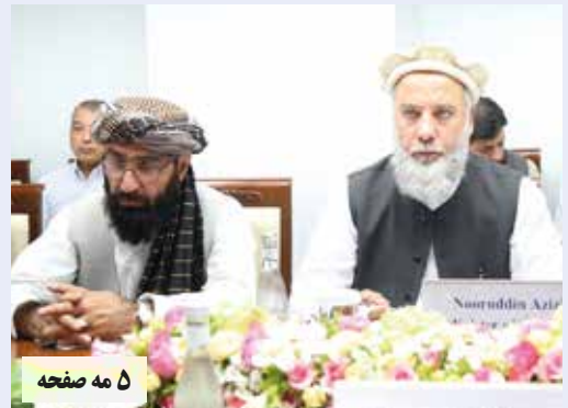
۵ مه صفحه