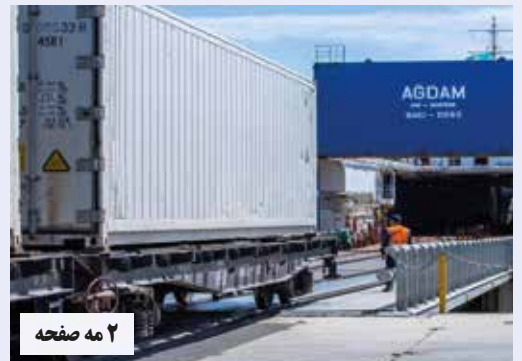
۲ مه صفحه