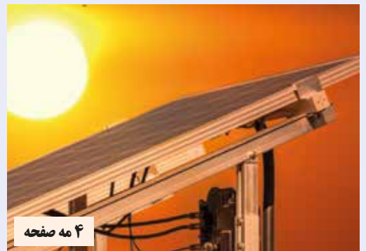
۲ مه صفحه