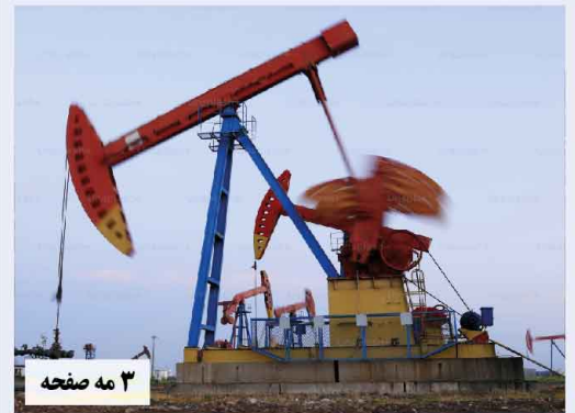
۳ مه صفحه