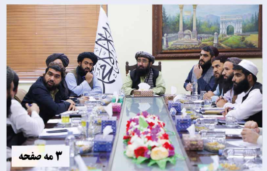
۳ مه صفحه

په همدې موخه يې تر دې مهاله د هېواد د بغلان د غوري او پروان د جبل السراج د سيمنتو دوې سترې توليدي فابريکې فعالې کړې دي. د کندهار د شوراندام او د هرات د سيمنتو فابريکو جوړولو چارې روانې دي. د غوري سيمنتو فابريکې توليد په ۲۴ ساعتونو کې ۶۰۰ ټنو ته رسېږي. د دې فابريکې مسوولينو ويلي، هڅه کوي دغه کچه په ۲۴ ساعتونو کې ۱۴۰۰ ټنو ته لوړه کړي. دې کچې ته په رسېدو به د سيمنتو له پلوه د هېواد ۱۴ سلنه اړتيا پوره شي. د دې ترڅنگ د پروان ولايت د جبل السراج د سيمنتو توليدي فابريکه له ۲۰ کلن ځنډ وروسته بېرته فعاله شوه. د سيمنتو دا توليدي فابريکه اوسمهال په ۲۴ ساعتونو کې ۱۰۰ ټنه سيمنت توليدوي. د ۲۰۲۳ ميلادي کال د اکتوبر په ۱۲مه نېټه د ۲۲۰ ميليون ډالرو په پانگونې سره د قطر او افغاني شرکت سره د جبل السراج د سيمنتو فابريکې قرارداد لاسليک شو. د دې قرارداد له مخې به د جبل السراج د سيمنتو فابريکه په کلني ډول د يو نيم ميليونه ټنه سمنتو د توليد ظرفيت پيدا کړي. په افغانستان کې د سيمنتو فابريکو په فعالېدو سره به له يوه لوري افغانستان نور د سيمنتو واردولو ته اړتيا پيدا نه کړي، له بل لوري به پانگونې ته زمينه برابره، زرگونو کسان به په دندو وگومارل شي او اقتصاد به مو پرمختگ وکړي.