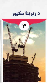
د زېربنا سکتور