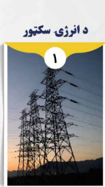
د انرژي سکتور