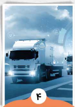
د ترانسپورت سکتور