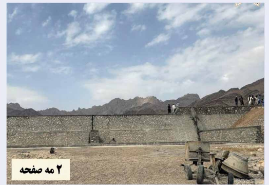
۲ مه صفحه